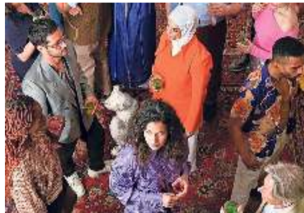
'Café 749' is gezellig, maar bedreigd.

Cultuurverslaggever Jaap Stiemer presenteert wekelijks zijn keuze uit het actuele aanbod van kunst en cultuur. Van boeken tot theater, van tentoonstellingen tot concerten.